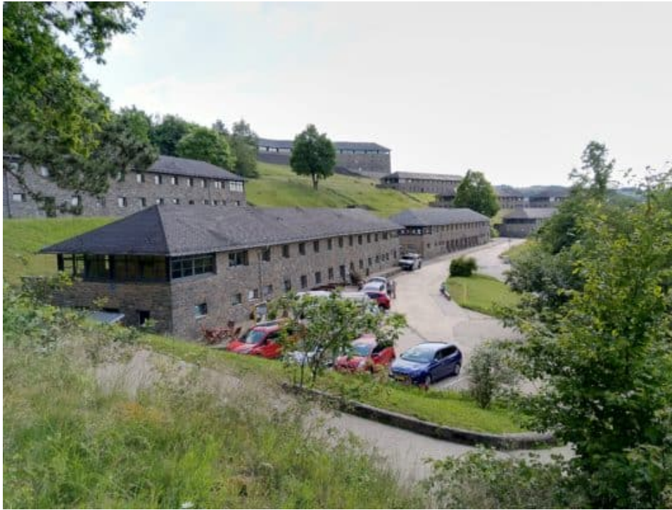
Het hoofdgebouw van Kamp

Vogelsang, dat initieel als opleidingscentrum voor kopstukken van de NSDAP gebouwd werd, herbergt nu 2 musea. Het ene deel "Bestimmung Herrenmensch" bevat de tentoonstelling over de Ordnungsburg Vogelsang, het opleidingscentrum, het ander deel "Wildnis(t)räume" gaat over het Nationaal Park Vogelsang. Om bij ons onderwerp te blijven, bezoeken wij de tentoonstelling "Bestimmung Herrenmensch". Het voelt raar om hier na zoveel jaren weer rond te lopen. De trappen te beklimmen naar het hoofdgebouw en de eetzaal, de toren te zien vanwaar ik als dienstplichtige nog van heb Abgeseild en te zien hoe het grootste deel van de legeringsgebouwen gesloten is vanwege verval. Een heel ander gevoel dan de toeristen die voor het nationale park en de musea komen.